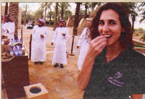
Imatges de diferents capítols de la sèrie 'Ebrencs pel món'

3a TEMPORADA: Maig, juny i juliol. Les tres temporades també es veuran per tot Catalunya, a través de TDI i de la Xarxa (50 televisions locals), un cop s'haja produït l'estrena a Canal TE i Canal TE24.