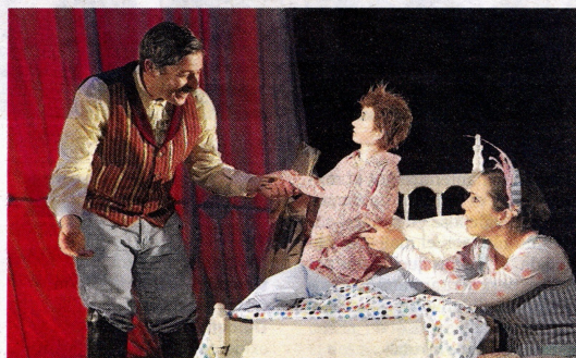
'Mare Terra', de la compañía Príncep Totilau, es un espectáculo de títeres y actores para público familiar.

En cuanto a la programación teatral, el plato fuerte será La