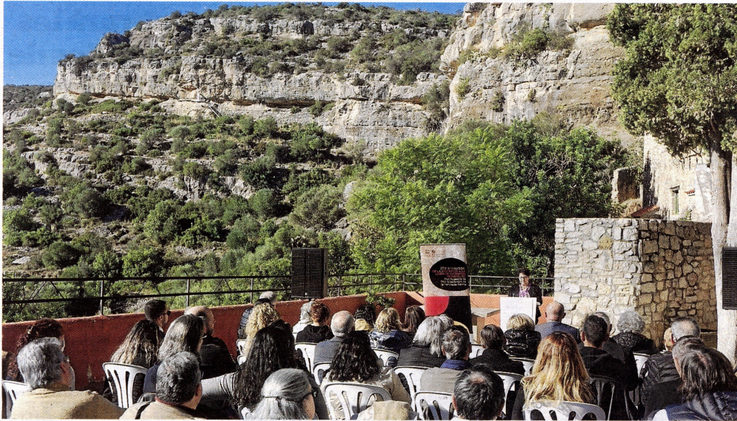
Acte de celebració d'aquest dissabte a l'Ermita de la Pietat. Al fons es troben els Abrics, a la serra de Godall.