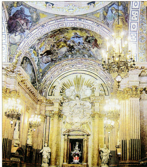
Capella de la Cinta, amb el Reliquiari actual exposat i -a la dreta- portada del llibre.

La tesi fins ara més estesa, acceptada i poc qüestionada és que després el tresor va ser dipositat al Banc d'Espanya -primer a Tortosa, abans de la crema de les esglésies del 31 de juliol, i després a Barcelona- i que en el cas del Reliquiari major, va ser embalat en un bagul i portat a Mèxic a bord del Vapor Vita, que hi va transportar un fons artístic espanyol amb l'objectiu d'al·leugerir