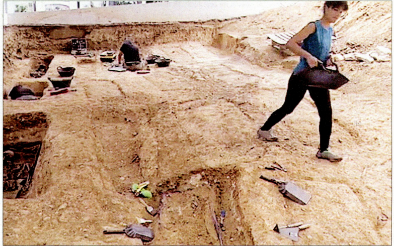
Treballs d'exhumació de la fossa del cementiri de Masdenverge.

Els treballs es van iniciar a l'abril perquè l'Ajuntament farà obres de remodelació de l'espai per a assegurar l'estructura i impermeabilitzar d'alguns dels nínxols, a més d'instalar nous columbaris, gràcies a un romanent de tresoreria. ■