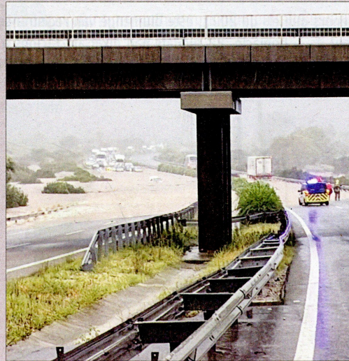
Els aiguats van inutilitzar fins i tot l'autopista.

El gros dels efectes dels forts aiguats caiguts a les Terres de l'Ebre i sobretot al Montsià es va concentrar diumenge, 3 de setembre, al matí, després de tota una nit de pluja torrencial. La ciutadania, que ha tingut faena ingent a les plantes baixes inundades, va fer unes 300 trucades a Protecció Civil. Bombers van atendre 150 avisos a les Terres de l'Ebre entre la vesprada de dissabte i el matí de diumenge i, entre moltes intervencions per a traure aigua d'edificis, van haver de fer una dotzena d'actuacions de rescat de persones atrapades als cotxes o a les cases, entre elles dos persones en un mas de l'Aldea on va col·lapsar el sostre. La major part dels rescats, però, es van dur a terme al Montsià. El Cos valorava a primera hora del diumenge que hi havia malmesos 19 edificis i 16 infraestructures, com ara passejos, carreteres i ponts. La imatge més simptomàtica era, de nou, el trencament de la carretera C-12 al punt de l'encreuament amb el barranc de la Galera. La via continua tallada al trànsit i les millores que es van introduir al calaix del barranc després dels aiguats del 2018, no han estat esta vegada suficients, perquè el Canal de la Dreta ha exercit de barrera. Altres carreteres de l'interior del Montsià es van tallar al trànsit durant el matí de diumen-