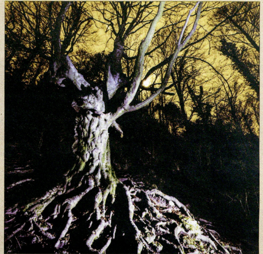
Dos fotografies de Lluís Ibàñez que es poden veure a la mostra 'Quan els arbres dormen' del Museu de les Terres de l'Ebre.

tegren la mostra. "L'exposició vol ser un homenatge a estos gegants supervivents i mostra una part d'aquest meravellós patrimoni natural del territori, uns arbres únics als que no hauria de ser di-