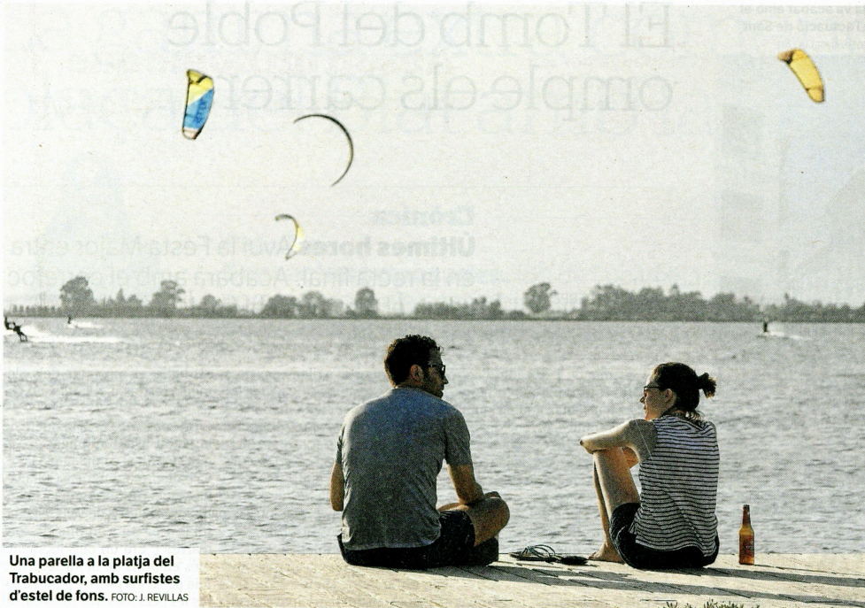
Una parella a la platja del Trabucador, amb surfistes d'estel de fons.