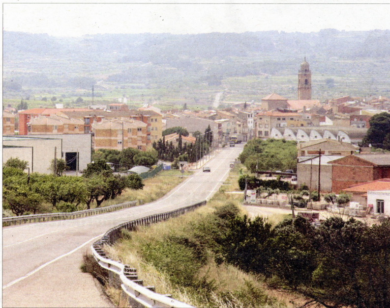
Una imatge d'arxiu de Gandesa.