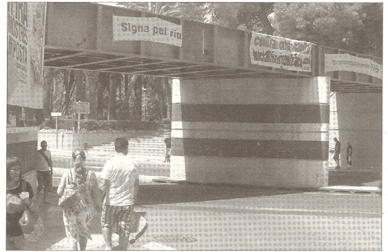
L'avinguda de la Generalitat, que canviarà a partir del 6 de setembre, quan se'n retire el pont.

En la mateixa roda de premsa, Bel també ha assenyalat que les obres del pont de damunt del riu ja estan "molt avançades" i que a finals d'any estaran enllestides. ■