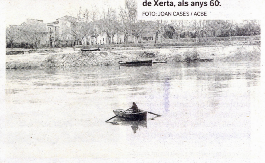
Mercedes Verdura, la barquera de Xerta, als anys 60.

«Normalment abans les fotografies es feien en esdeveniments socials o actes institucionals i la dona llavors tenia poc paper. No apareix en inauguracions o partits polítics, per