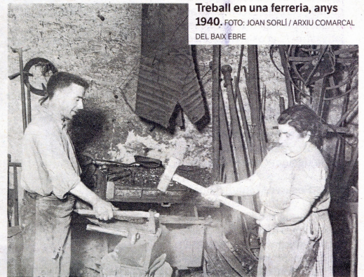
Treball en una ferreria, anys 1940.