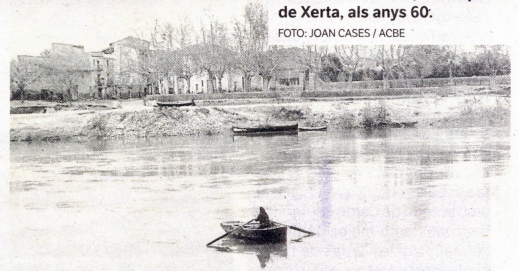
Mercedes Verdura, la barquera de Xerta, als anys 60.

«Normalment abans les fotografies es feien en esdeveniments socials o actes institucionals i la dona llavors tenia poc paper. No apareix en inauguracions o partits polítics, per