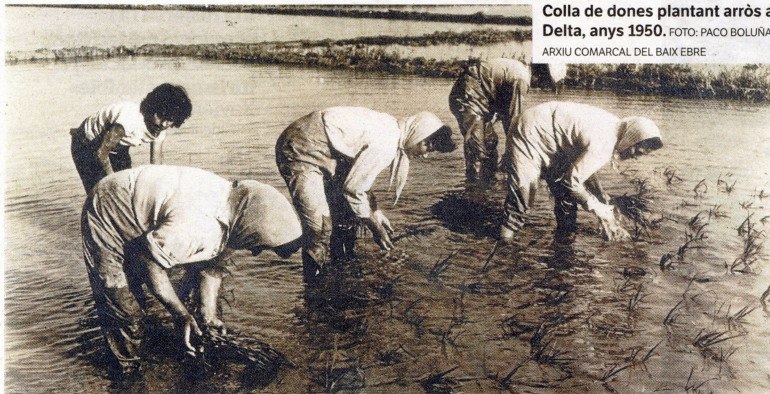
Colla de dones plantant arròs al Delta, anys 1950.