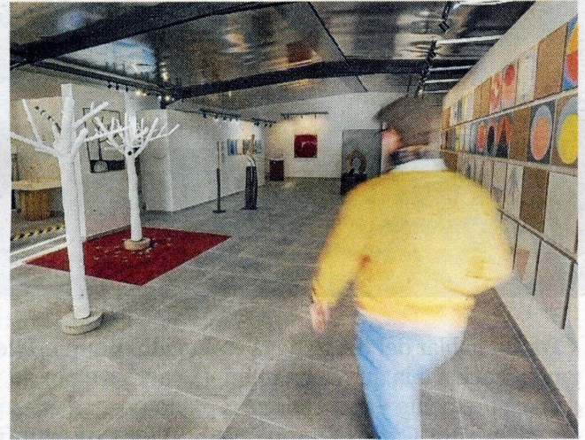
Un centenar de obras de artistas de Inglaterra, Suecia, Holanda, Francia, España y Catalunya, así como escultura africana y de otras partes de Europa se exhiben entre olivos y algarrobos en el exterior, y en la galería interior de arte contemporáneo.

za tiene una gran influencia: «Para mí, son muy importantes los materiales con los que trabajo porque transmiten su personalidad en cada obra, por lo que hay que respetarlos y no manipularlos excesivamente, sino colaborar con ellos».