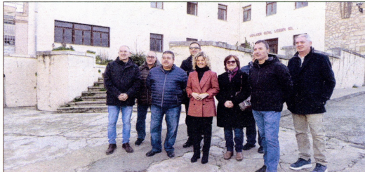
L'alcaldesa, regidors de barri i presidents d'associacions de veïns, davant de l'edifici que s'enderrocarà, perpendicular al que acull l'antic menjador Mossèn Sol. A la dreta, plànol del complex i de la ubicació del futur equipament.

El pavelló per a oferir més espai a entitats esportives de la ciutat i donar vida als barris del nucli antic s'aixecarà en paral·lel a la muralla del Rastre, després d'enderrocar els edificis ruïnosa que envolten l'antic claustre dels Josepets. Les obres podrien començar el segon semestre del 2023