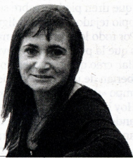
MARIA LLOP @diarideltarragona

Si el Fons té l'objectiu de reparar una pèrdua econòmica, la seva definició hauria d'anar encaminada a això. Acceptant que sempre hi haurà un cert desajust amb l'impacte efectiu a causa de la complexitat de la realitat, el Fons hauria de fixar-se en els territoris on es materialitzarà aquesta pèrdua econòmica. Desviar recursos cap a altres zones veïnes no és necessàriament negatiu, però no respon a la idea perseguida amb aquest instrument.