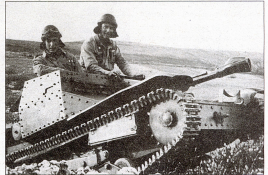
Una tanc Fiat L35 (a l'esquerra), el model que es troba al fons de l'embassament de Flix, i el mateix tanc, durant la Guerra Civil espanyola.

de que hi pugui haver un altre vehicle a prop. Tots dos estarien situats prop de la fàbrica d'Ercros, però fora de l'actual tancat de palplanxat que es va construir durant la descontaminació. Al municipi sempre s'ha comentat l'existència d'este tanc al fons del riu, que sembla que va quedar avariada durant l'entrada de les tropes franquistes, i s'hauria optat