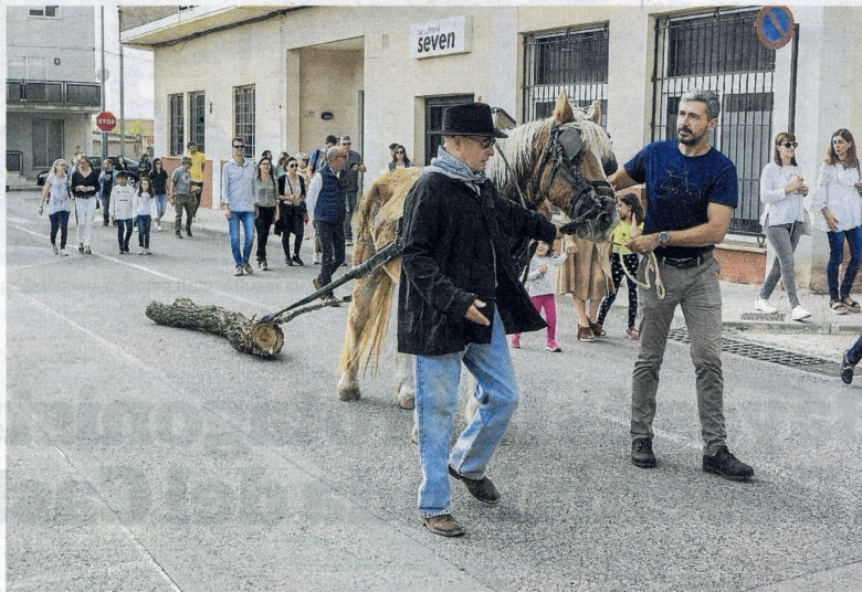
La Festa recorda l'ofici d'arrossegador, que permeté desenvolupar el sector al poble.