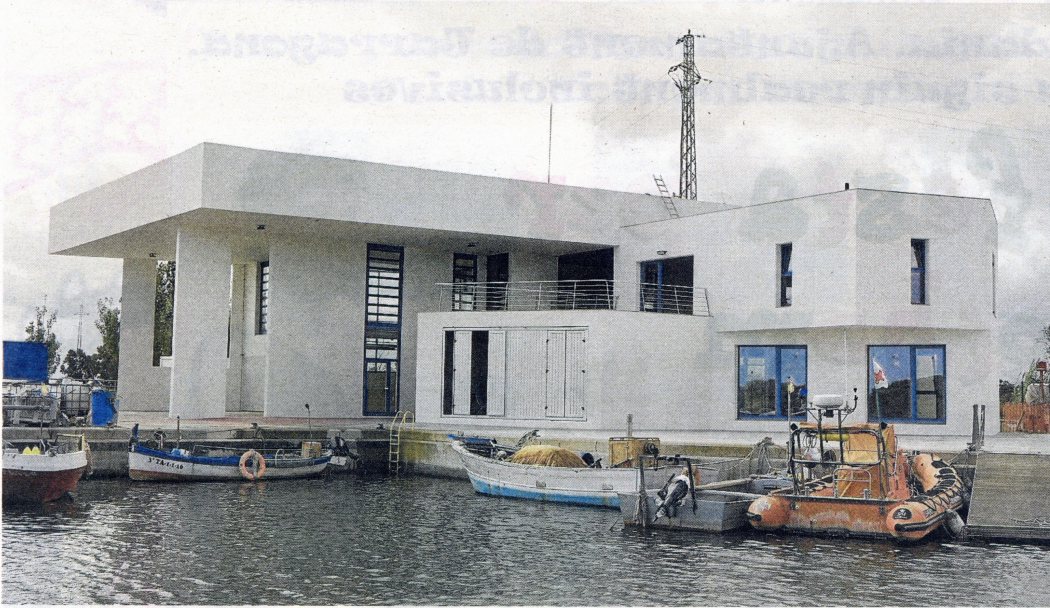
Amb el nou edifici els pescadors no hauran de transportar el peix fins al municipi, situat a deu quilòmetres.