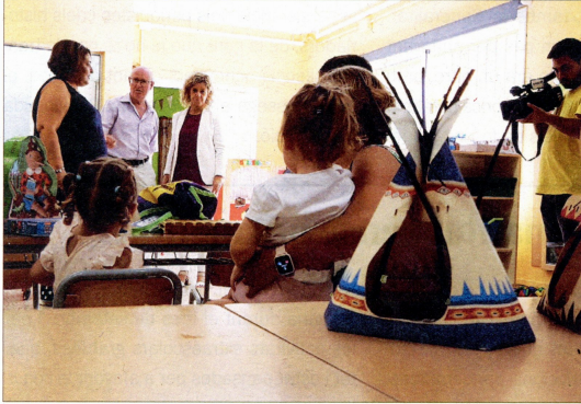
El Reguers disposa des d'este curs una nova llar d'infants municipal.

23 de les 119 llars rurals catalanes estan a l'Ebre