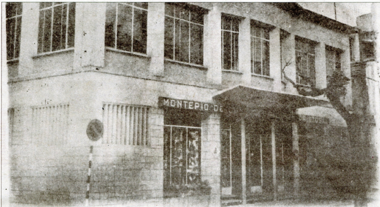
Primera seu del Montepio al carrer Cervantes de Tortosa, fotografia de l'abril de 1972.

El Montepio sempre s'ha adaptat a les necessitats de la societat, seguint la filosofia dels primers fundadors de facilitar la vida a la gent