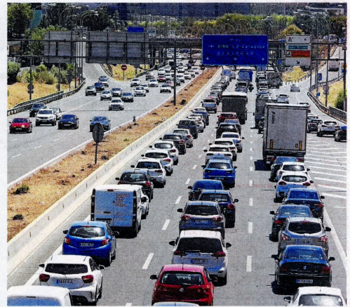
Imagen de la M-40, en Madrid, ayer, el primer día de la primera operación salida de este verano.