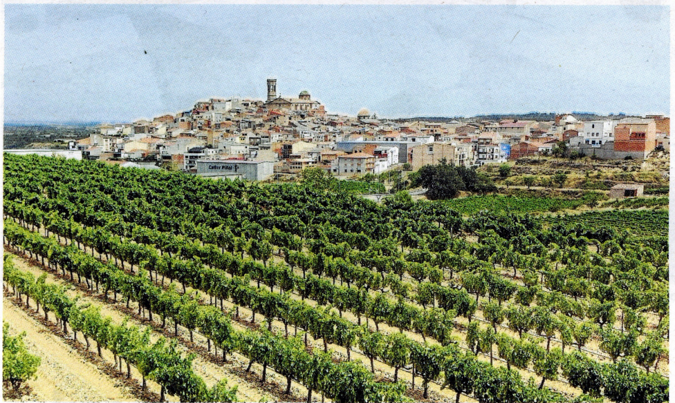
Panoràmica del poble de Batea, envoltat de vinyes, valls i barrancs.

El fenomen de fèrtils terres l'han caracteritzat per les diferents civilitzacions que s'hi han assentat.