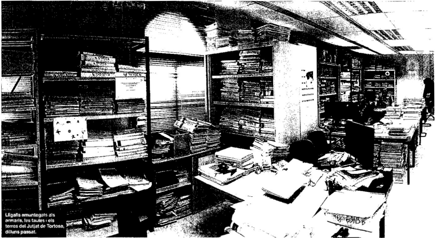
Ligalls amuntats als armaris, les taules i els terres del Jutjat de Tortosa, dilluns passat.

LA SITUACIÓ DE L'ADMINISTRACIÓ DE JUSTÍCIA