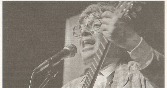
Els Quicos es van sumar a l'esperit fester del Carnaval i en la segona part del concert van aparèixer disfressats a l'escenari.