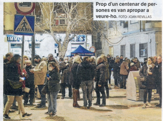
Prop d'un centenar de persones es van apropar a veure-ho.

monument franquista fins que el Tribunal Superior de Justícia de Catalunya (TSJC) es pronuncie sobre el recurs contra la descatalogació del monòlit (feta per l'Ajuntament), presentat també per COREMBE. Aquesta descatalogació va tenir lloc la tardor del 2020 en un ple extraordinari, que va aprovar, amb l'únic vot contrari del regidor de Ciutadans, la modificació del POUm per retirar el monument franquista del catàleg d'edificis i conjunts històrics i artístics.