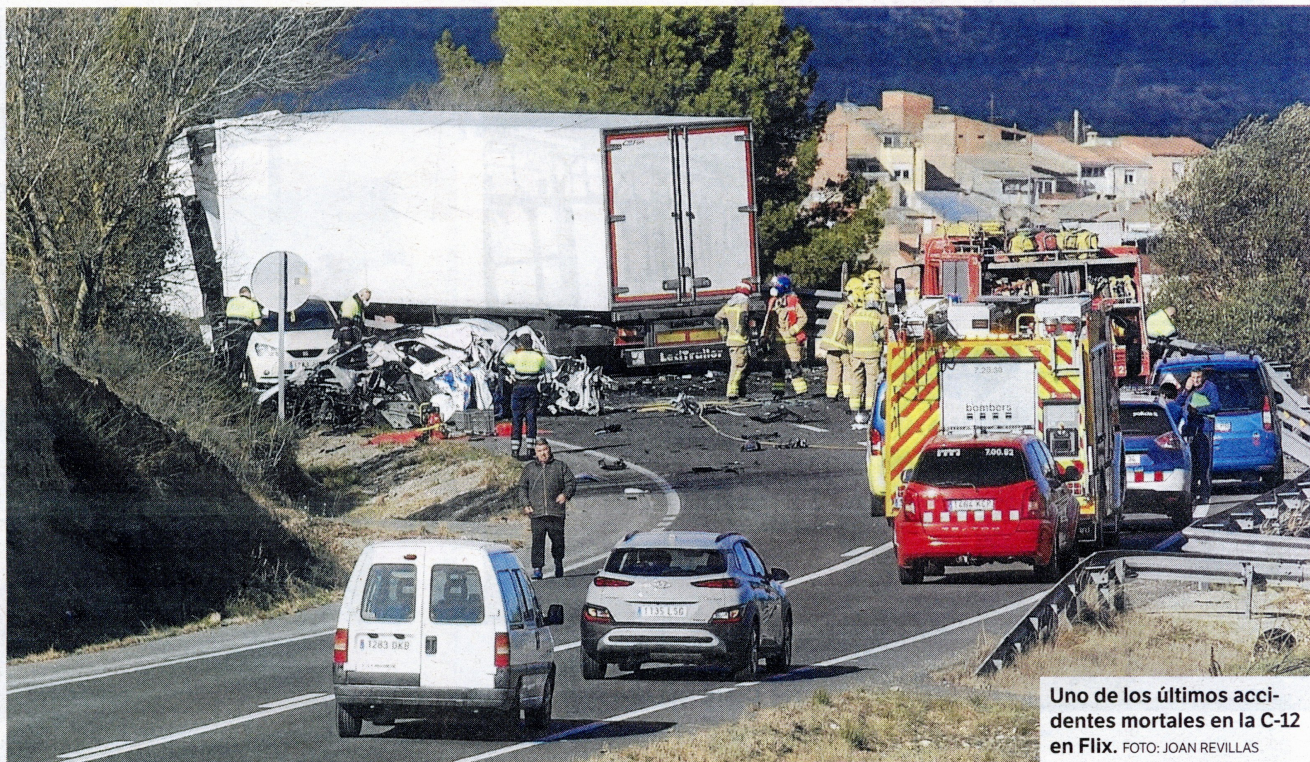
Uno de los últimos accidentes mortales en la C-12 en Flix.