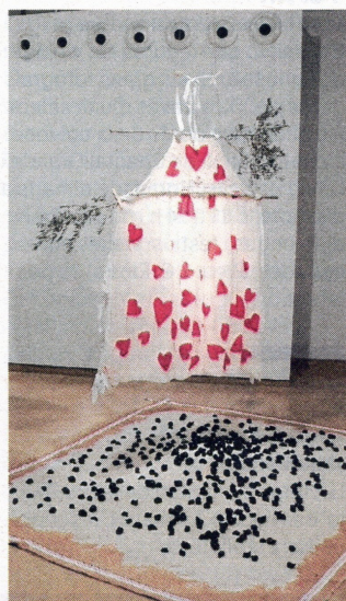
La muestra se puede visitar has-

En este sentido, interpreta Vidal, predominan conceptos relacionados con una visión «apocalíptica» de la historia del