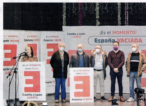
España Vacía, en las elecciones de Castilla y León.

El precedente de Teruel Existe Este partido político se presenta este domingo en tres provincias de Castilla y León. Además, en Soria concurre la veterana formación Soria ¡Ya!, como agrupación de electores, a imitación de lo que hizo Teruel Existe en las últimas elecciones generales, consiguiendo entrar en el Congreso de los Diputados con un escaño.