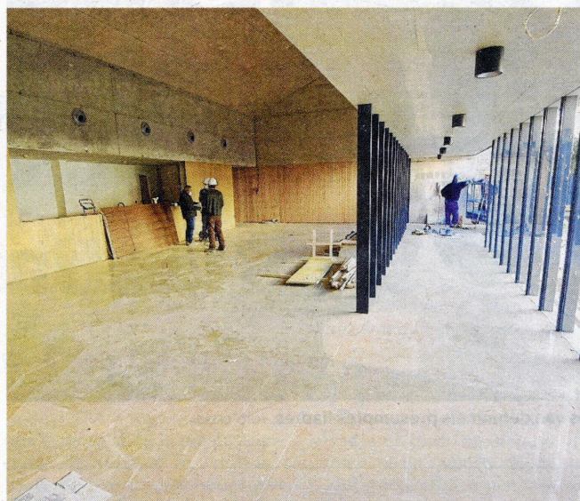
Zona d'accés al nou equipament cultural, que vol esdevenir referent al municipi i al territori.

Les entitats locals han visitat les obres i han fet diverses aportacions al projecte, per tal d'adequar l'edifici a les seves futures necessitats.