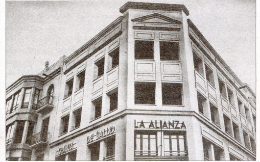
Imatges antigues de la Clínica Terres de l'Ebre, en el moment de la seua construcció, la façana de l'antic centre i d'un dels quiròfans.

no existien tantes mútues com avui dia, i la majoria tenien la seua pròpia xarxa sanitària, de consultes i d'hospitals, per la qual cosa només atendien els seus associats. De fet, fins a la inauguració de l'Hospital de Tortosa Verge de la Cinta, el 1976, va ser el principal centre sanitari de referència de la població de les Terres de l'Ebre, del Baix Maestrat i del Baix Aragó. Aleshores, tal com mostra una de les imatges, al seu voltant no hi havia res, es tractava de solars i descampats, que van permetre ampliar la capacitat del centre sanitari, i, així, els seus serveis.