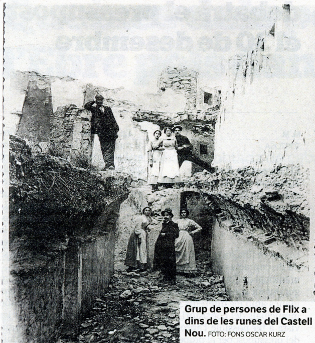
Grup de persones de Flix a dins de les runes del Castell Nou.

Arxius. Flix ha digitalitzat el fons Oscar Kurz Hobert, que, entre altres, mostra mitjançant imatges els efectes de la guerra sobre el municipi