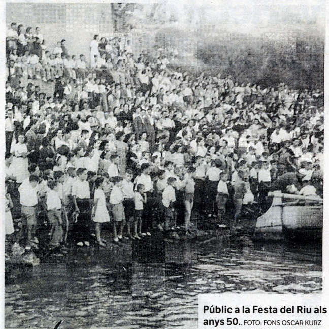
Públic a la Festa del Riu als anys 50.