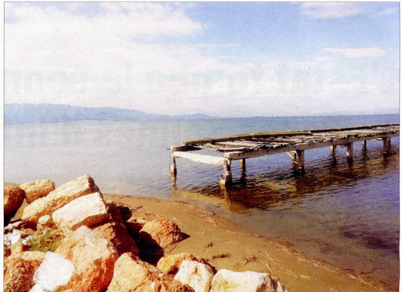
L'antic moll de fusta de les Salines, actualment desballestat.

RIGIDESA EN UN ENTORN CANVIANT Un altre dels arguments exposats en contra de la solució plantejada es relaciona amb el fet que esta és "una obra rígida que comporta el dipòsit de milers de metres cúbics de material petri de diferent naturalesa, entre escullera, pedra i llast, en el llit marí i en un entorn natural protegit com és el de la Punta de la Banya, amb l'única finalitat de satisfer les necessitats funcionals i operatives de l'explotació de les Salines de la Trinitat, una activitat industrial rígida en la seua concepció, protegida per dics, que es troba ubicada dins un espai natural canviant".