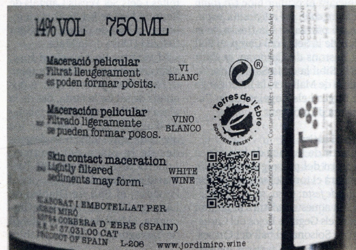
Segell de la Reserva de la Biosfera, en una ampolla de vi.

«Aquesta marca va ser una de les fites més importants que vam aconseguir al territori per posar