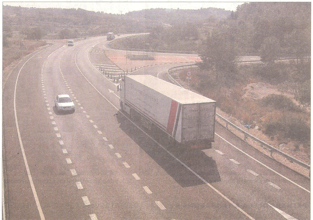
L'actual N-340 a l'altura del terme del Perelló.