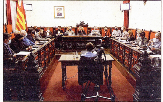
El ple es va tornar a fer, per segona vegada en pandèmia, amb la presència de tots els regidors i regidores.