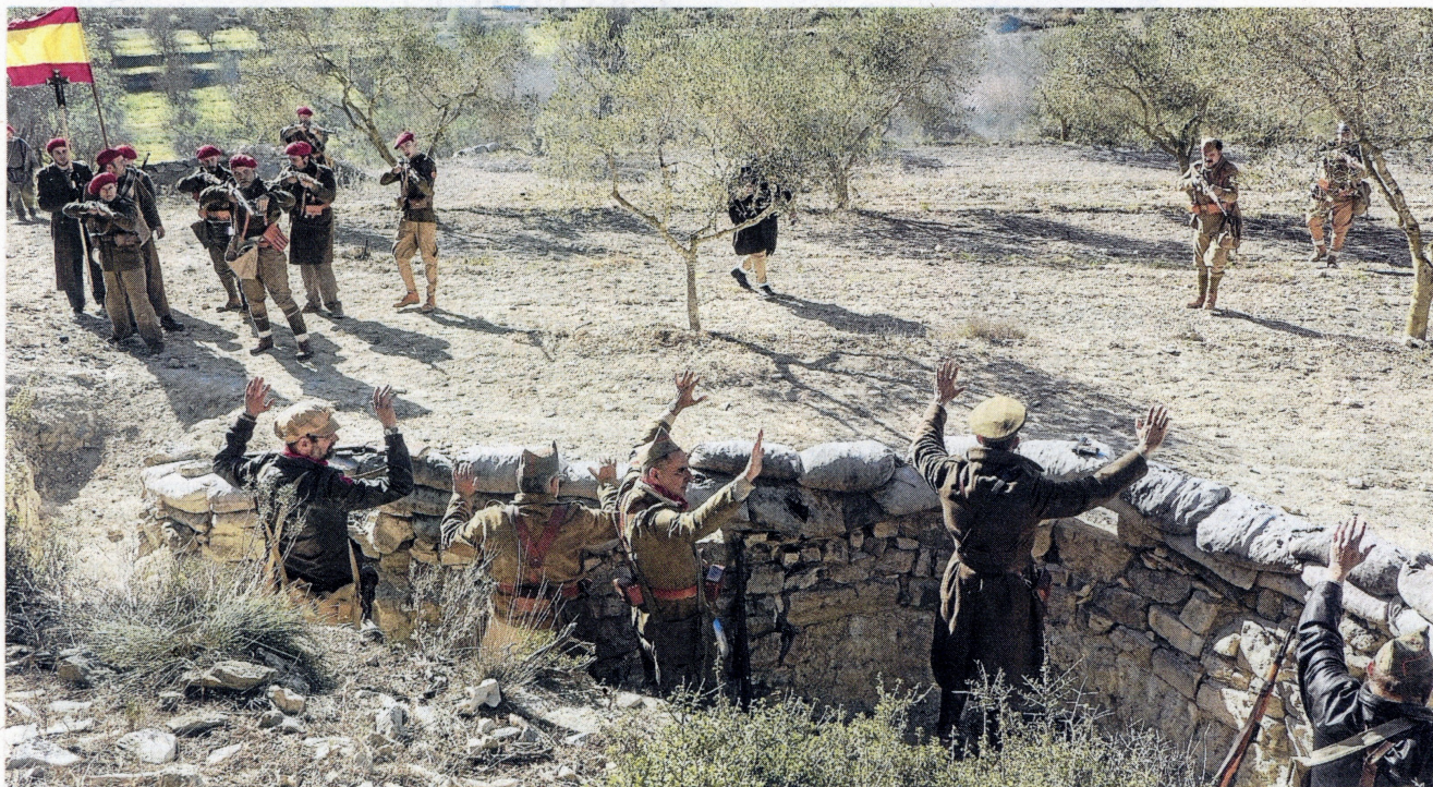
Una seixantena de recreadors van reviuere l'últim combat de la Batalla de l'Ebre a la cota 562.