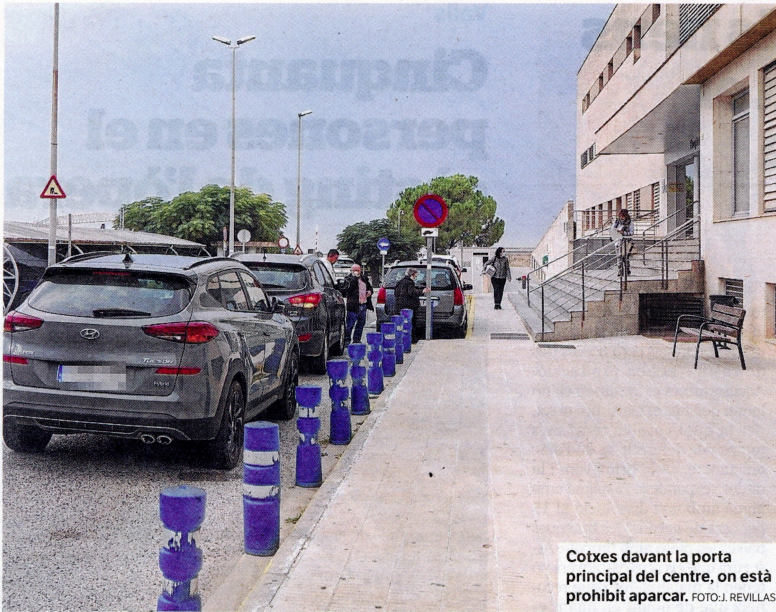
Cotxes davant la porta principal del centre, on està prohibit aparcar.