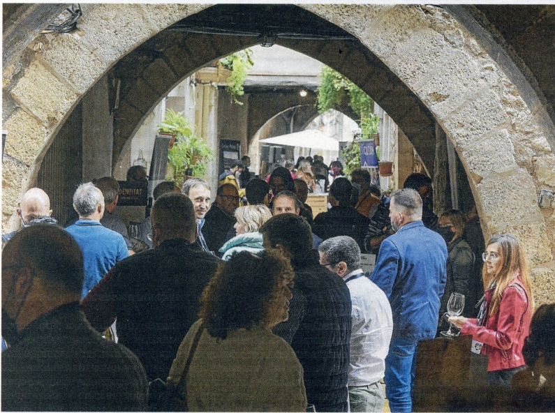
Presentació pels carrers del nucli antic de Batea.

El Consell Regulador vol situar la comarca com una de les principals destinacions del sector a Catalunya