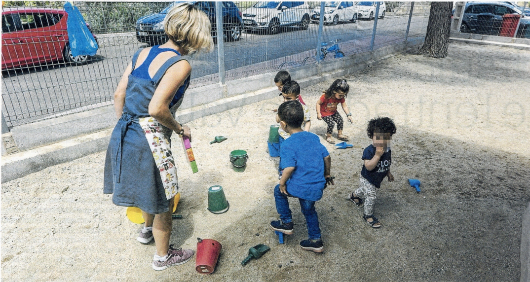
La llar d'infants rural de Vinebre, el curs passat.