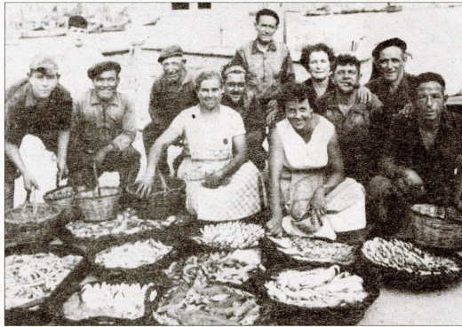
Dos de les prop de 1.200 imatges que apareixen al llibre fotogràfic L’Abans. Sant Carles de la Ràpita .

Es tracta d’un projecte que el seu autor, l’historiador Toni Cartes Reverté, va començar l’any 2019, a través de la cerca de famílies que volguessin cedir documents gràfics per tal d’il·lustrar com era el municipi. A través de la mateixa recerca, així com