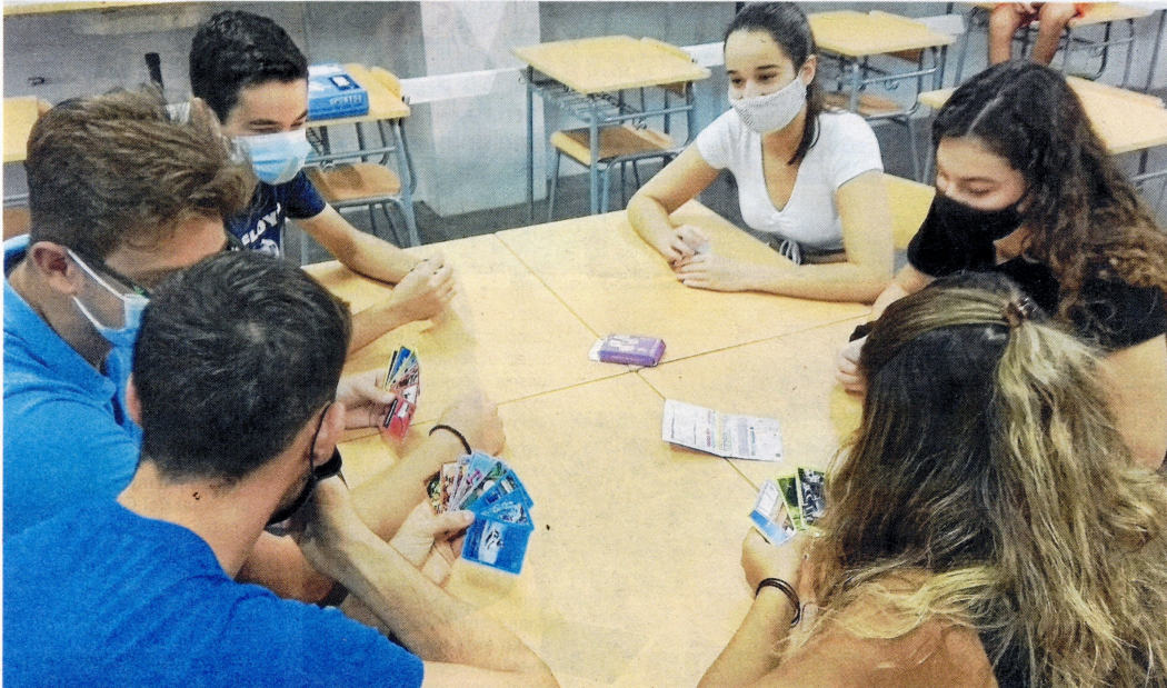
Estudiants jugant amb un dels jocs ja acabats.