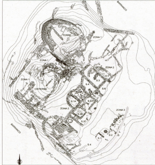
Planta general del coll del Moro. DIBUIX DE L'INSTITUT CATALÀ D'ARQUEOLOGIA CLÀSSICA. ARQUEÒLEGS, RAFAEL JORNET I M. CARMÉ BELARTE

Ser cruïlla i pas obligat determina que les tropes dels diferents exèrcits havien d'ocupar Gandesa, com a indret estratègic. I per esta circumstància el nucli urbà s'ha destruït en diferents episodis bèl·lics. Els carrers del nucli antic poc han canviat, però el reducte emmurallat que defensava i rodejava el municipi va desaparèixer a la guerra dels Segadors i es van obrir les portes que el tancaven a l'exterior. El castell que encara es conservava va quedar enderrocat totalment 200 anys més tard, durant els