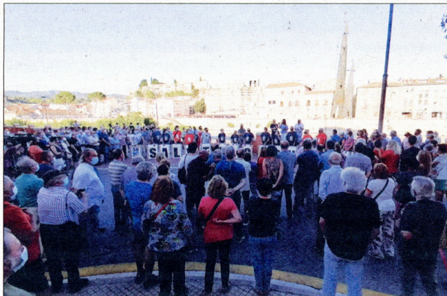
A dalt, dos de les portaveus de la Comissió per la Retirada en l'acte de projecció de l'obra d'Ignasi Blanch sobre la pilastra. A sota, concentrats en favor del manteniment i retirada del monument.

militaristes. Estos elements han de ser eliminats de l'espai públic sense que esta raó comporte cap pèrdua de coneixement sobre el passat" , va dir Carles Vallejo, president de l'Associació Catalana d'Expresos Polítics del Franquisme, en la seua intervenció davant els convocats que s'havien aplegat a la platja fluvial de Ferreries, a tocar de l'aigua i del mateix monument.