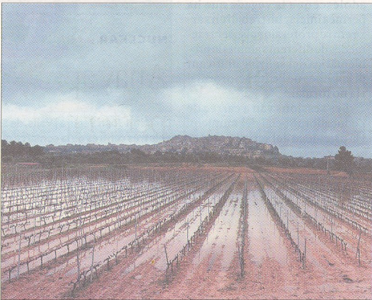
La intensa precipitació a Horta de Sant Joan, prop de 60 litres en dos dies, ha deixat alguns camps de cultiu inundats.