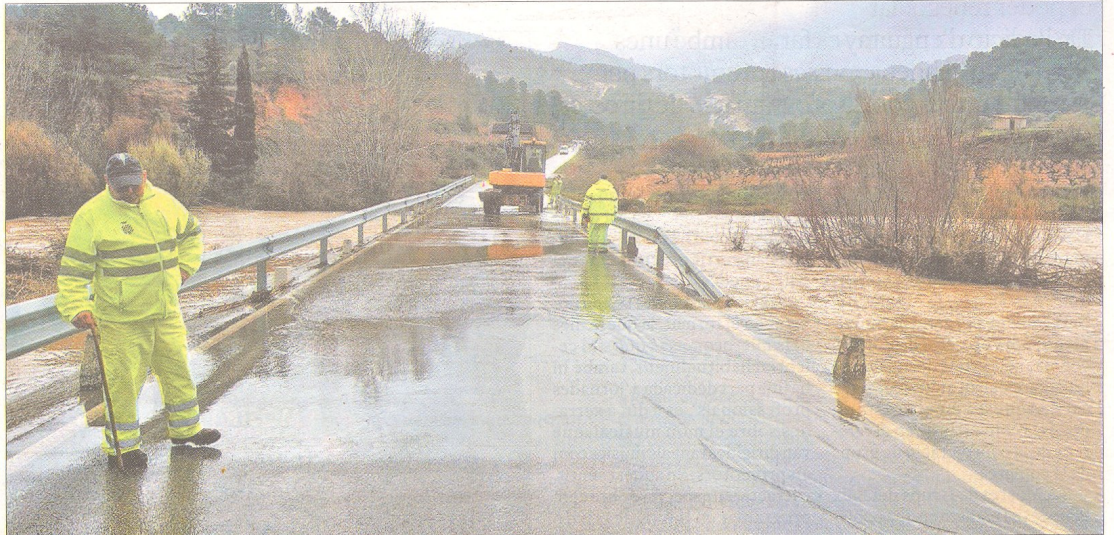
La carretera local entre Bot i Prat de Comte va quedar tallada al trànsit pel desbordament del riu Canaletes.

Al Baix Ebre també es va produir la crescuda de molts barrancs que desemboquen al riu Ebre i algunes esllavissades. És el cas de la carretera de pujada al Seminari, a la ciutat de Tortosa, que es va haver de tallar per la presència de roques a la calçada.