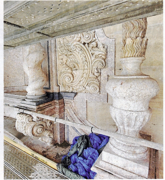
Alguns dels elements després del procés de recuperació.