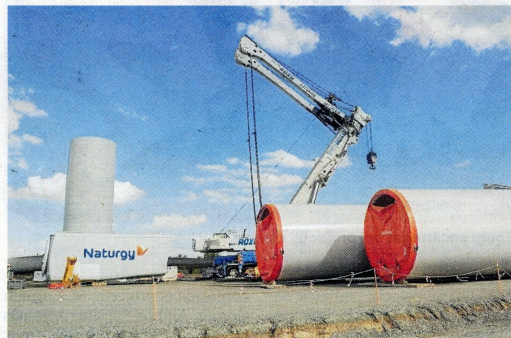
Treballs amb les enormes peces dels aerogeneradors, aquesta setmana.

Naturgy preveu que els 13 aerogeneradors de Barrancs i Punta Redona, a Vilalba, Batea i la Pobla, estiguin operatius a finals d'enguany