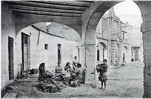
Fotografia antiga amb els pòrtics de la plaça inacabats.