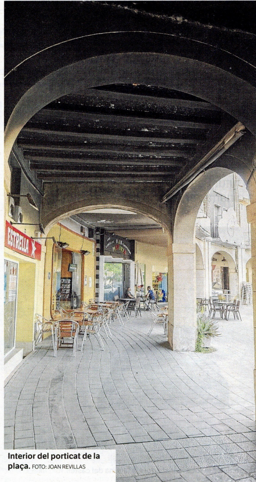
Interior del porticat de la plaça.