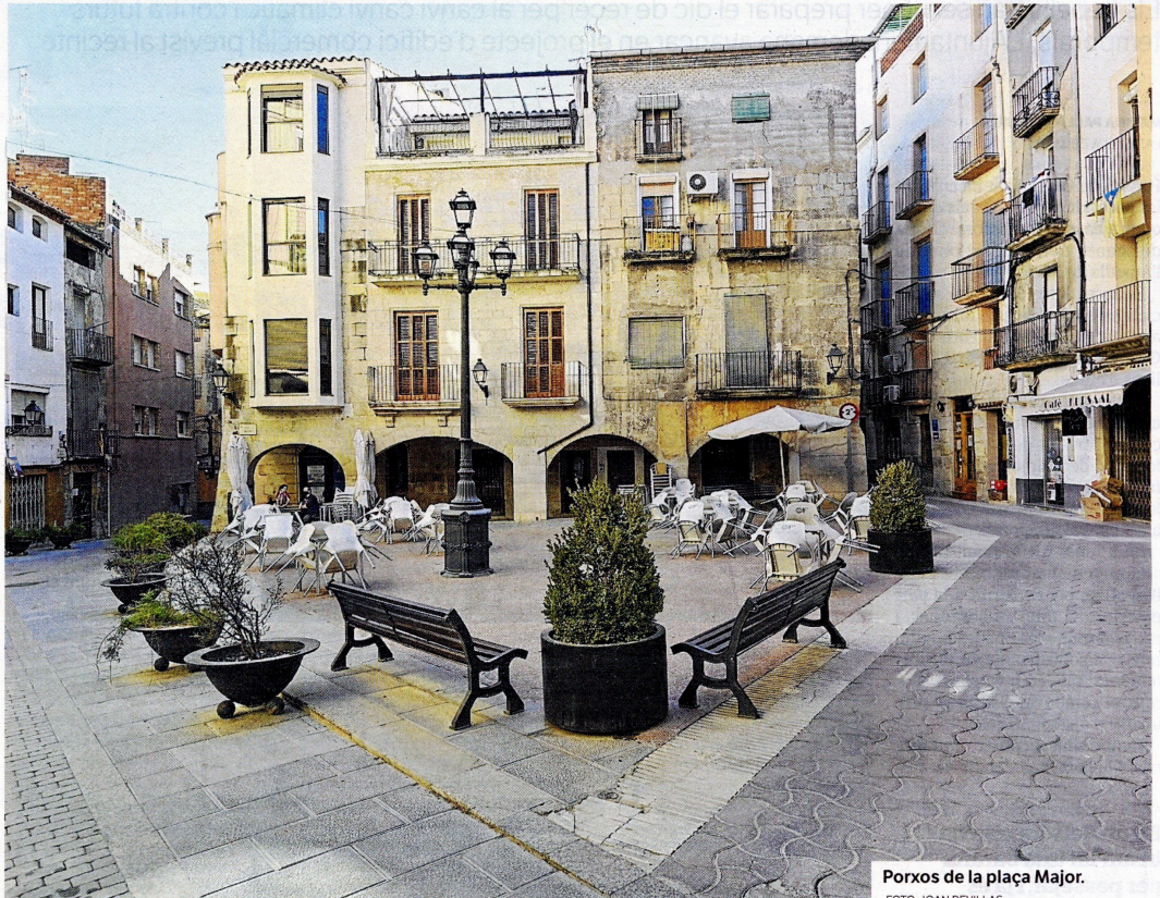
Porxos de la plaça Major.

L'any 1360 el rei Pere III va concedir a la vila el privilegi de fer mercat setmanal tots els dimarts