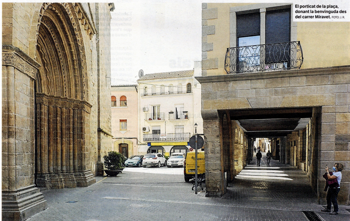
El porticat de la plaça, donant la benvinguda des del carrer Miravet.