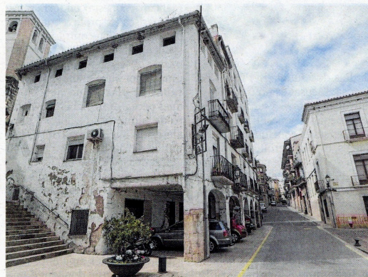
Els porxos davant el carrer de la Palla, pujant al castell.

Amb una furia may vista, fent estragos sens igual, ebro arribá a este senyal, obrant la major conquista, que de'll se conta'n lo anal.