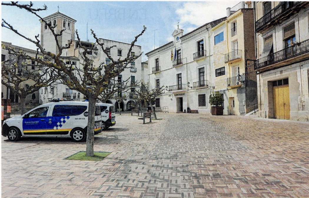
La plaça amb l'església al fons, els edificis porticats i l'Ajuntament.