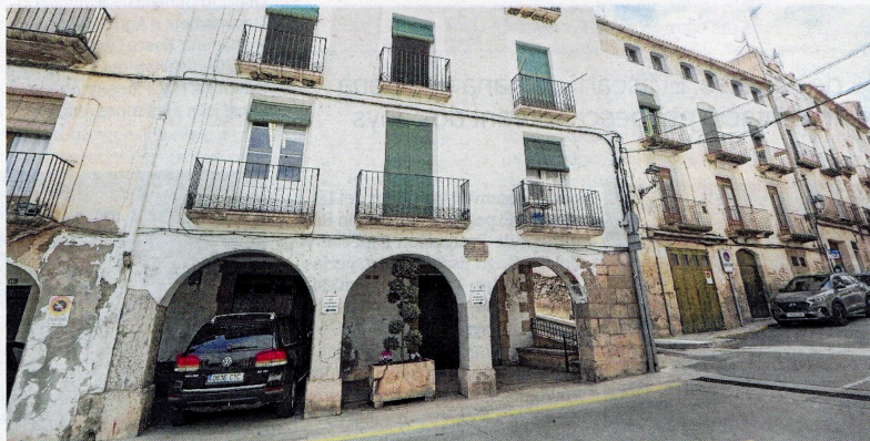
Els edificis porticats de la plaça.

bigues de fusta que els cobreixen respecte al primer. El segon pilar al costat del castell té una placa superior amb una inscripció on s'assenyala la cota de la pujada del nivell del riu el dia 9 d'octubre de 1787 i una segona inscripció gravada a la pedra del basament del pilar fent referència a la riuada del 23 d'octubre de 1907.