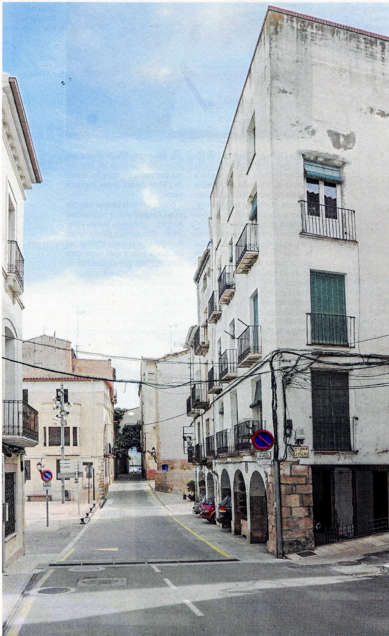
Els pòrtics de la plaça amb el portal i el carrer de la Barca al fons.